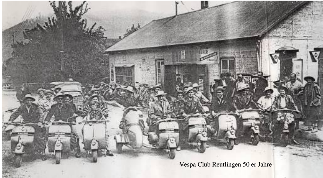
Vespa Club Reutlingen 50 er Jahre

Der 1. Vespa Club Reutlingen wurde in den 50 er Jahren gegründet. Bereits deren Mitglieder sind mit ihren Vespas auf Tour gegangen. Manche von ihnen auch bis nach Italien.